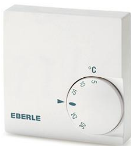
Схема подключения инфракрасных обогревателей через терморегулятор